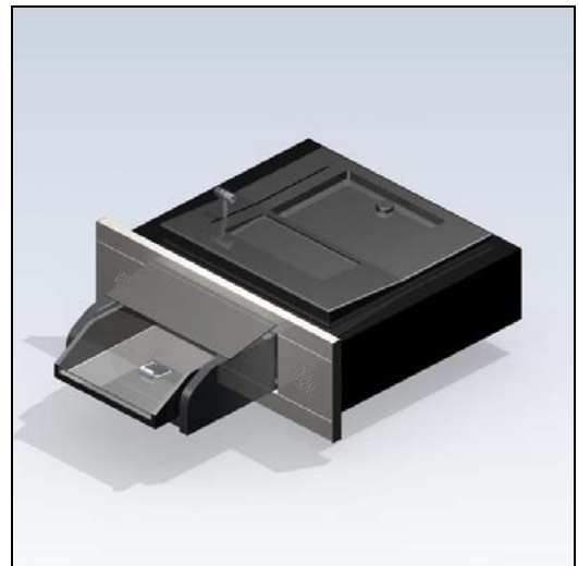
Sprechanlage SITEC-DELTA ist integriert